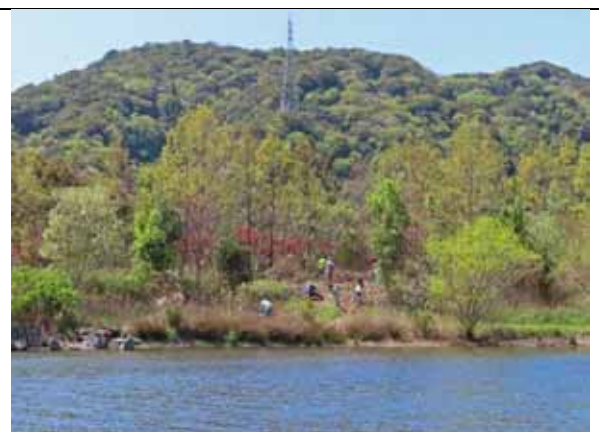
展望ゾーンの整備