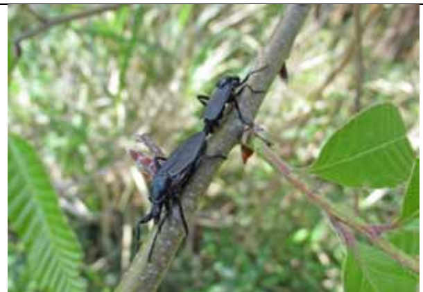
ハグロケバエ(交尾)