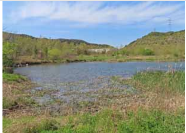
ヒメガマ拡大部の伐採