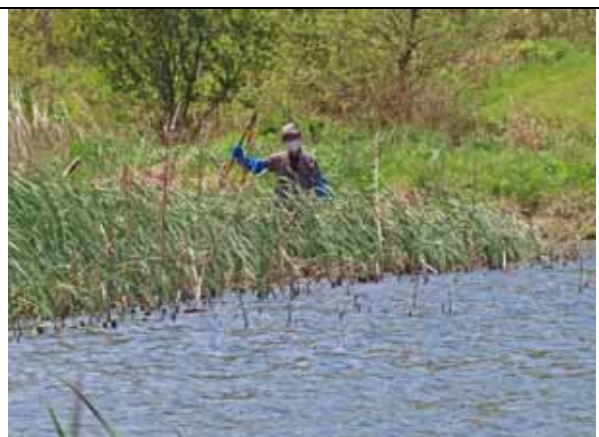
ヒメガマ保全ゾーンの管理