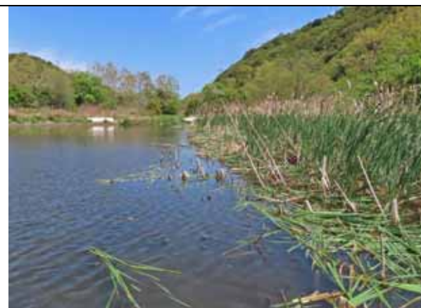
ヒメガマ拡大部の伐採