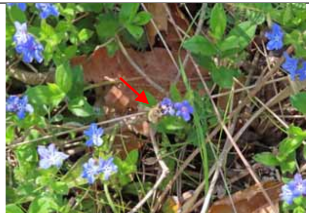
ホタルカズラ とヒゲナガハナバチ