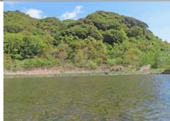
ヒメガマ保全ゾーン