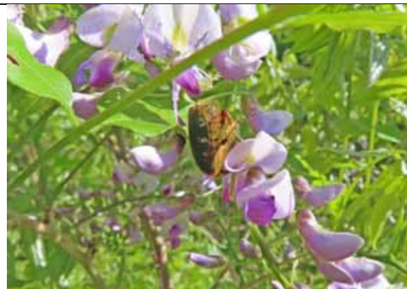
フジ とコアオハナムグリ