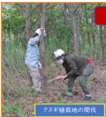
クヌギ植栽地の間伐