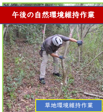
草地環境維持作業