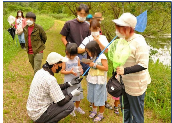
右上の円内の写真は、尾端に卵を付けたマイコアカネのメス