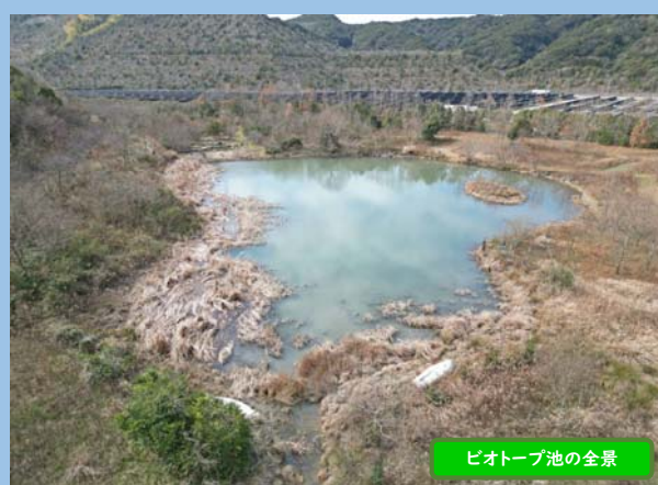
ビオトープ池の全景