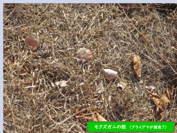
モズガニの殻 (アライグマが捕食?)