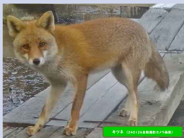
キツネ (240126自動撮影カメラ画像)