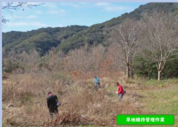
草地維持管理作業