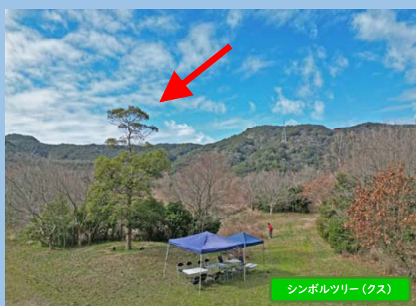
シンボルツリー(クス)