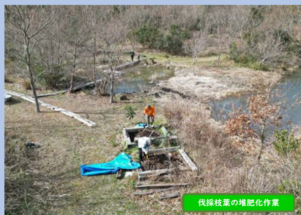
伐採枝葉の堆肥化作業