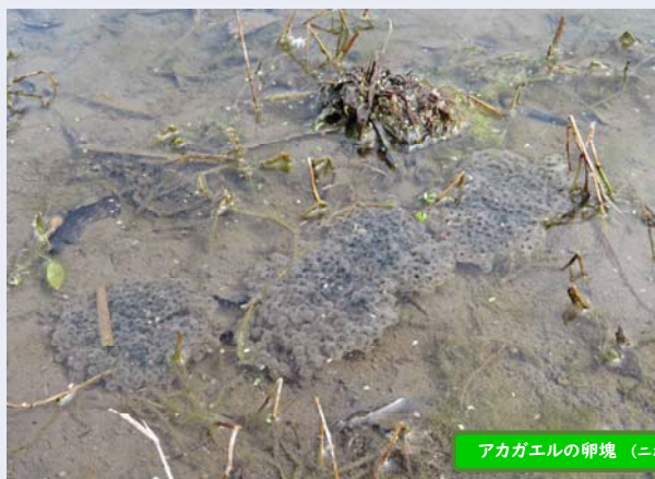
アカガエルの卵塊 (ニホンアカガエル・ヤマアカガエル)