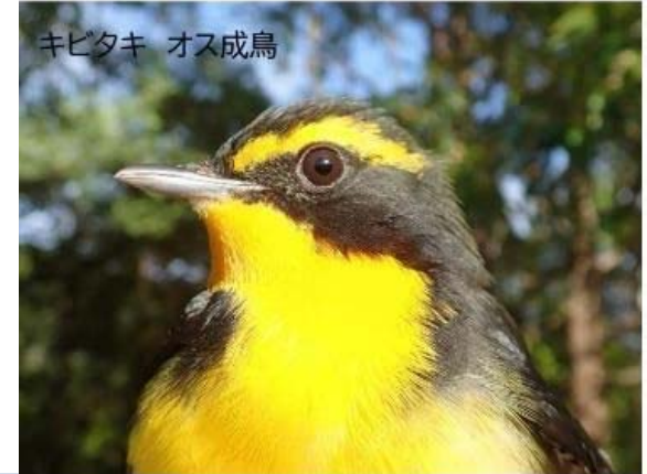
写真説明：鳥類標識調査で標識を付けた個体