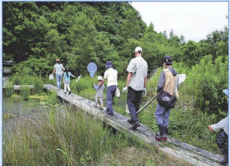
岬町の多奈川ビオトープ

企業や住民らの取り組みで生物多様性の保全が図られている地域として環境省が選ぶ「自然共生サイト」に、府内で新たに2か所が内定した。近く正式認定されれば府内で計6か所となる。政府は、2030年までに陸と海の30%以上の自然を保全する「30by30(サーティー・バイ・サーティー)」を目標に掲げており、関係者は「認定を契機にさらに保全の輪を広げたい」と意気込んでいる。(北口節子)