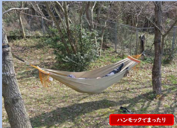
ハンモックでまったり