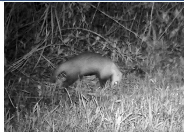
写真の説明：夜間、区域内を歩く「アナグマ」