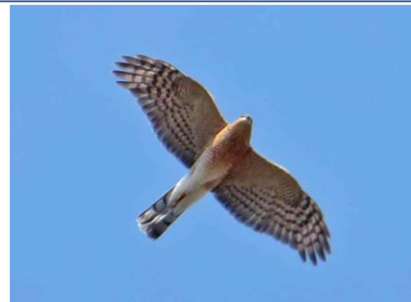
写真説明：区域内の上空を低く飛ぶ「ハイタカ」

http://www.town.misaki.osaka.jp/material/files/group/7/tanabiozukan.pdf