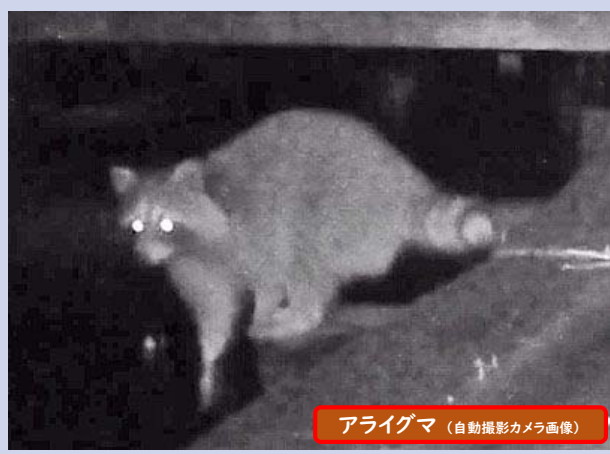
アライグマ (自動撮影カメラ画像)