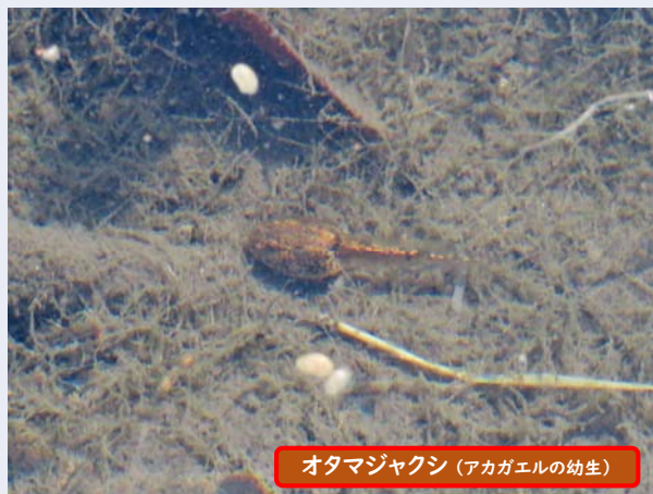
オタマジャクシ (アカガエルの幼生)