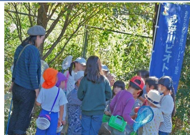
写真説明：本サイトでの自然観察会の様子

http://www.town.misaki.osaka.jp/material/files/group/7/tanabiozukan.pdf