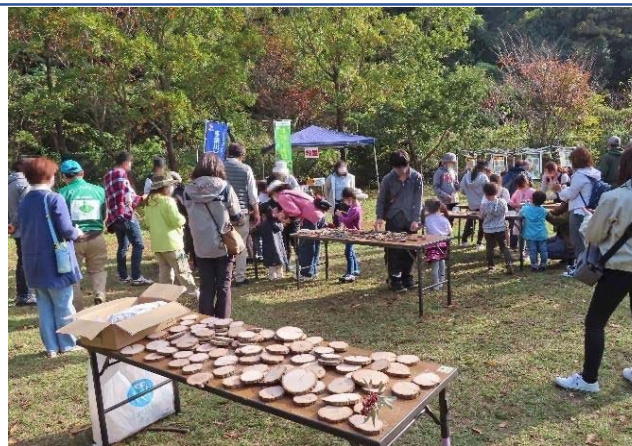
写真説明：本サイトでの自然体験イベント（木工）