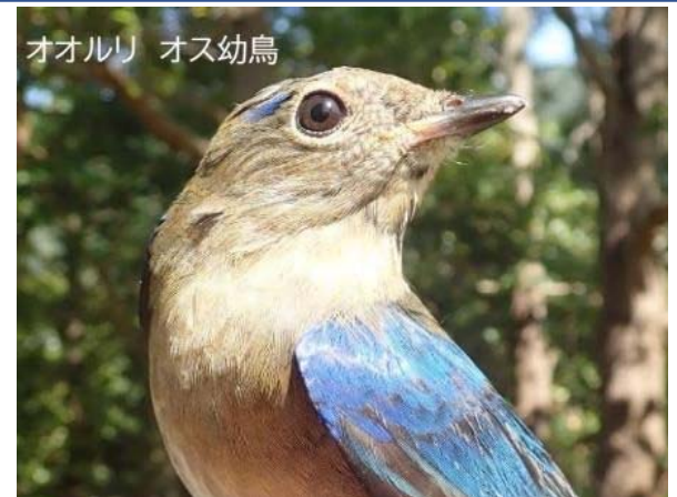
写真説明：鳥類標識調査で標識を付けた個体