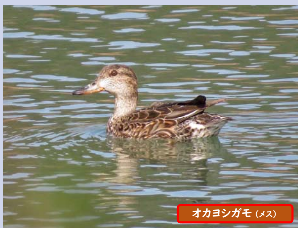
オカヨシガモ (メス)