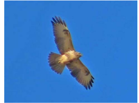
写真説明：区域内の上空を旋回する「ノスリ」