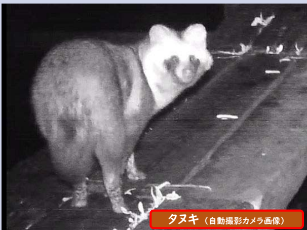
タヌキ (自動撮影カメラ画像)