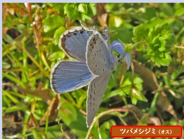
ツバメシジミ (オス)