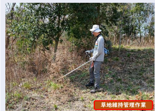
草地維持管理作業