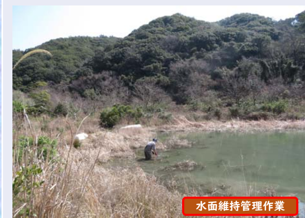
水面維持管理作業