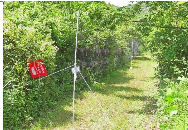
写真説明：鳥類標識調査実施中

http://www.town.misaki.osaka.jp/material/files/group/7/tanabiozukan.pdf