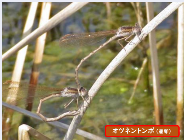
オツネトンボ (産卵)