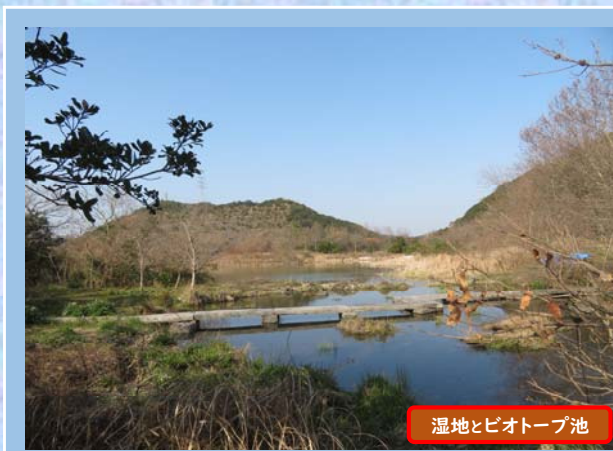
湿地とビオトープ池