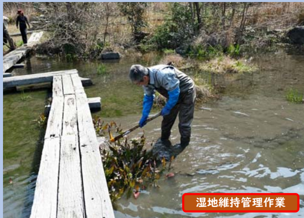
湿地維持管理作業